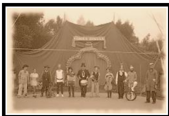
Le Cirque au grand complet.