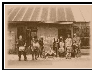
Déambulation et spectacle en tous lieux.

La musique vivante est inséparable du spectacle.